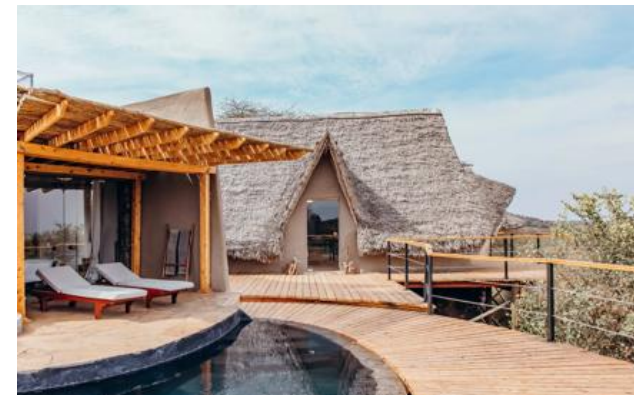
Membre Relais & Châteaux depuis 2013 Mbirikani Group Ranch Chyulu Hills - Amboseli

Lodge et restaurant dans une réserve animale privée. Réveil au pied des sommets enneigés du Kilimanjaro ; au loin, le rugissement d'un lion. ol Donyo Lodge est un pionnier parmi les safaris-lodges, précurseur du tourisme éthique et responsable: la collaboration avec la population Massaï locale a permis de combiner sauvegarde et subsistance. Installé sur les flancs des Chyulu Hills, ce lodge mélange design contemporain et traditionnel. C'est l'opportunité d'explorer l'Afrique d'une manière peu commune, à cheval ou en 4x4, ou encore posté dans une cache, à vingt pas de certains des plus grands éléphants du monde. Surplombant la savane à perte de vue, ol Donyo Lodge jouit d'une situation incomparable. C'est l'Afrique comme on l'imagine.